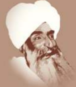
मानस-कागक्रषि :: ८ ::

दूत अयोध्या गए। दशरथजी बारात लेकर आए। ब्याह का मुहूर्त आया। माघ शुक्ल पक्ष पांचवीं तिथि, गोरज बेला। लोकरीति-वेदरीति शुरू होती है। जानकी-राम विवाह संपन्न हुआ। वशिष्ठजी ने जनकजी से कहा कि आप की एक कन्या ऊर्मिला और छोटे भाई कुशध्वज की दो पुत्रियां श्रुतकीर्ति और मांडवी तीनों का ब्याह इसी मंडप में हो जाय, बाप! जनकजी प्रसन्न हुए। इस तरह चारों भाईओं का ब्याह हुआ। फिर रास्ते में विश्राम करते-करते शुभ दिन पर बारात अयोध्या पहुंची। दिन बीतने लगे। सब को बिदाई दी। आखिर में विश्वामित्र को बिदा दी। संत की बिदा पर राजपरिवार बैचैन है। साधुपुरुष को किसी परिवार के प्रसंग में आनंदवृद्धि हेतु और बल प्रदान हो तो जाना चाहिए। पर कार्य पूर्ण होने के बाद वहां रुकना नहीं चाहिए। अपने भजन के लिए निकल जाना चाहिए। विश्वामित्र ने बिदा ली। अपनी तपस्थली पहुंचे। तुलसी कहे, राम-चरित्र सागर जैसा। इसका पार कौन पा सके? मेरी वाणी को पवित्र करने के लिए मैंने वर्णन किया। यहां ‘बालकांड’ पूरा होता है।